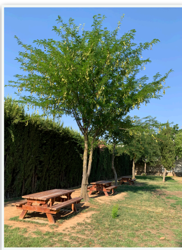
MESAS DE PICNIC